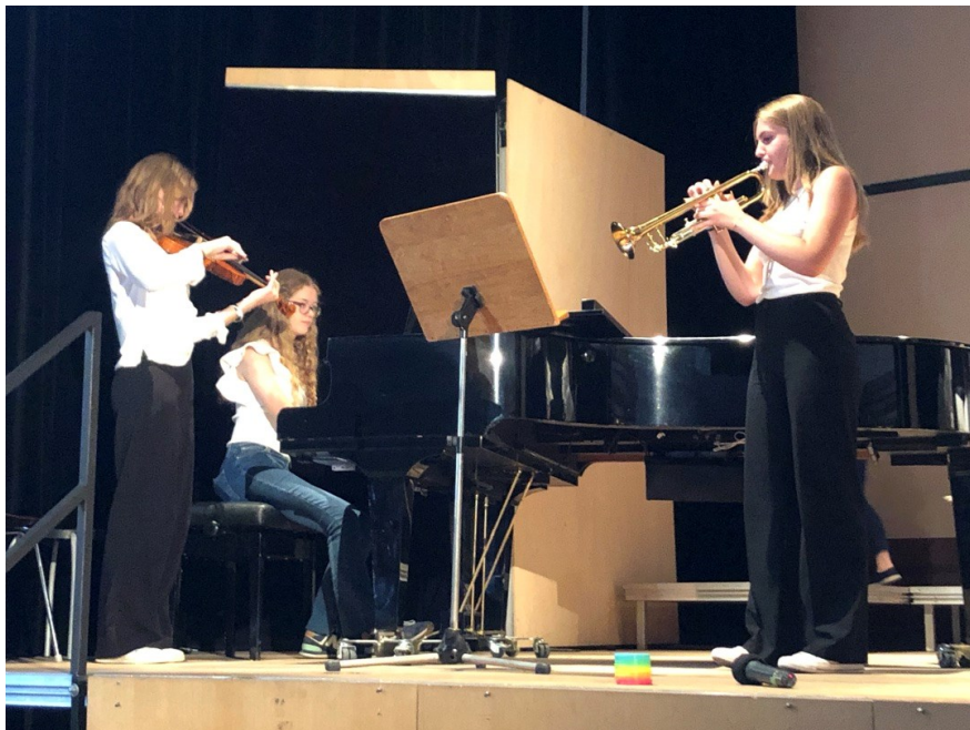
...vom Chor der Schule und Schülerinnen aus der Q1 Französisch bilingual