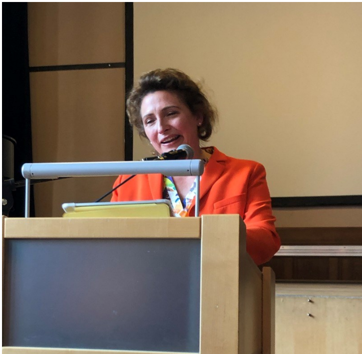
Ansprache von Frau Nicola Beer

Vizepräsidentin des Europäischen Parlaments