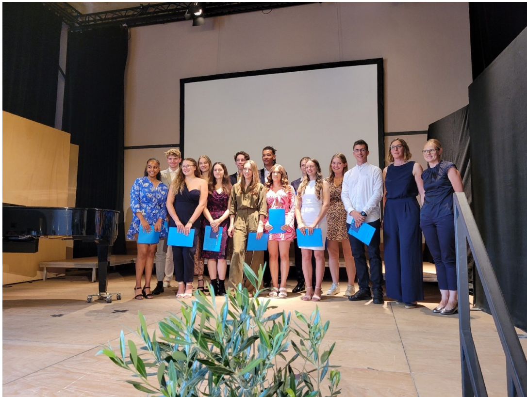
Festliche Verleihung der Abibac Zeugnisse